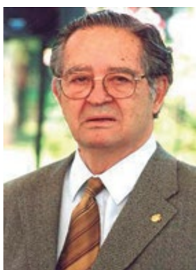
Ramón de la Fuente Muñiz.

E l Dr. Ramón de la Fuente Muñiz fue de los médicos más destacados del siglo XX, su libro clásico Psicología Médica fue texto único durante varias décadas. La 1ª edición se publicó en 1959 y la 2ª edición en 1992, editado por el Fondo de Cultura Económica. Se hacían reimpressiones cada uno o dos años. Se utiliza actualmente en