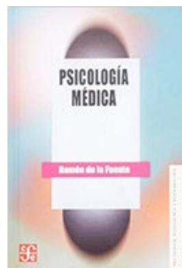
Pasta actual del libro