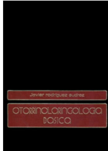
Primer libro de otorrinolaringología.