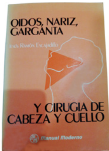
Primera edición de autor de provincia, radicado en Tijuana, Baja California.