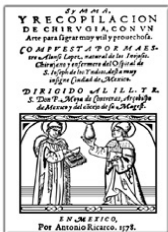
Primer libro de Cirugía