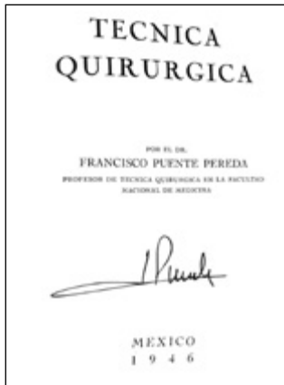
Firma y Pasta de la primera edición.