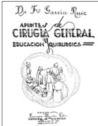
Portada de apuntes.